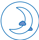
TRAVAIL DE NUIT