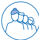
TRAVAIL EN ÉQUIPES SUCCESSIVES ALTERNANTES

Tous les salariés exposés à ces facteurs de risque ne bénéficient pas forcément du C2P. Ils doivent être soumis à un seuil minimal d'exposition.