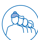
TRAVAIL EN ÉQUIPES SUCCESSIVES ALTERNANTES

L'exposition des salariés à un ou plusieurs des 6 facteurs de risque doit être déclarée si elle dépasse les seuils réglementaires.