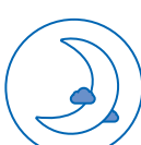
TRAVAIL DE NUIT